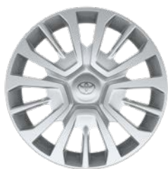
Jantes en acier 16" avec enjoliveurs Dynamic