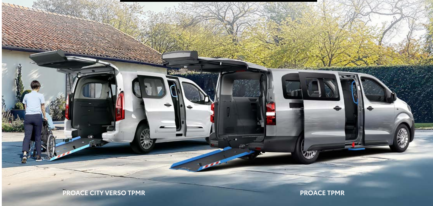
PROACE CITY VERSO TPMR