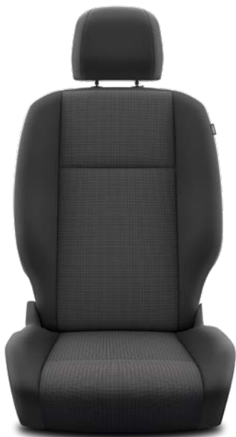
Sellerie Tissu Manhattan