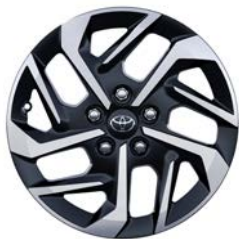
Jantes en alliage 16" Executive